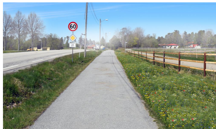
Fylkesvei 21. Eksempel på et enkelt tiltak som planting av en blomstereng mellom de to sentrumsområdene. Illustrasjon: Tanja Furueth