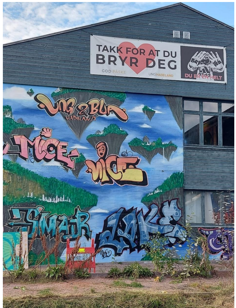
Eksempel på uteområder ved Frøystad som ikke er blitt stelt og som gror igjen.

Både arbeidspakken «Friluftslivets ferdselsårer, barnetråkk og trygge skoleveier», og arbeidspakken innen næringsutvikling «Forankring og utvikling av næringsstrukturen på Roa, henger nøye sammen med og støtter opp under arbeidspakken «Stedsutvikling og identitet». Samlingen 15. – 16.09 konkluderte også med behovet for å utarbeide et kunnskapsgrunnlag om mobilitet i Nordbygda som grunnlag for senere tiltak.