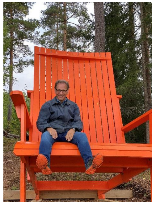
Stein-Owe i Lunnens store godstol.