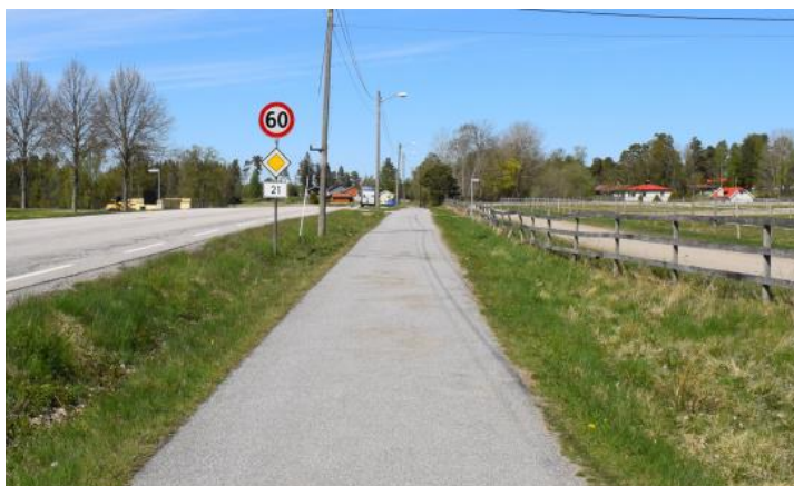
Fylkesvei 21 gjennom Fossby, dagens situasjon.